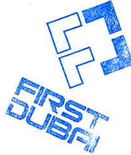
أ. إيلاف مكي محامي - ومسؤول أول مطابقة و التزام